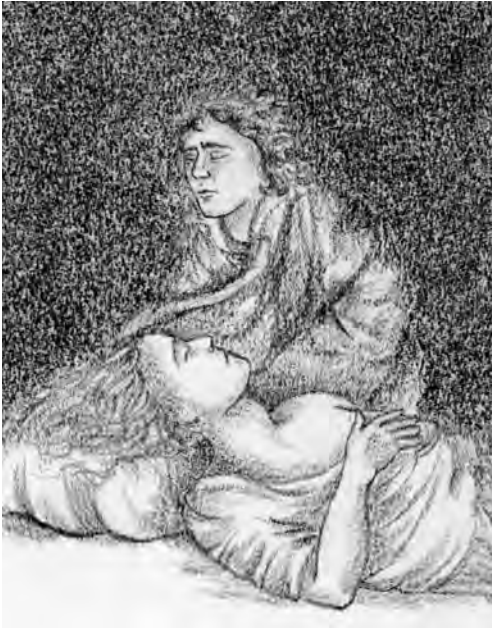
Figure 2. Raprezentazion dal insium indulà che Patroculus al comparìs intal insium di Achilles.

ogni insium analizât e ven mostrade la presince o mancual di une des carateristichis formâls dai insiums.