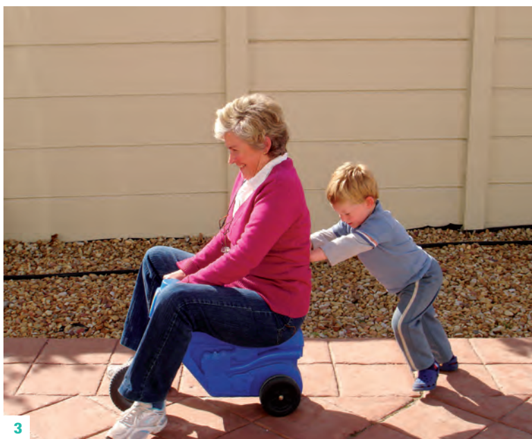
03. La longjevitât dai nonos, che a son simpri di plui rispîet ai plui piçui.

Dut câs, l'aspîet che mi somee plui rilevant al è il numar plui bas des previsionis dai zovins di etât 20-29. Plui di 5.000 zovins che a mancjin al apel, e no son dome forescj. Cheste e je une part di popolazion particolarmentri impuartante sedi tal presint che in prospettive future. Si trate, di fat, di zovins che a son prossims a jentrâ o che a son a pene jentrâts tal mont dal lavôr, e che a stan par tacâ o che a àn za tacade la lôr vite productive. La ipotesis interpretative di chest fenomen e je che al podedi jessi l'efiet su la popolazion residente de mobilitât dai students e de emigrazion viers i paîs forescj di zovins talians cun alte scolarizazion. Al è clâr che, par capî se